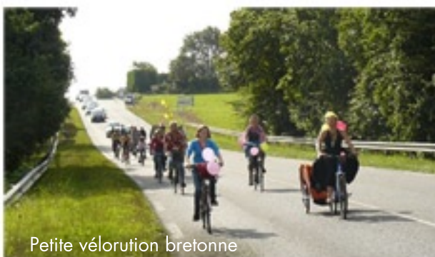
Petite vélorution bretonne

Des ateliers (décorations de vélos, réparations), la fête, manger, se baigner, parler et du VÉLO !