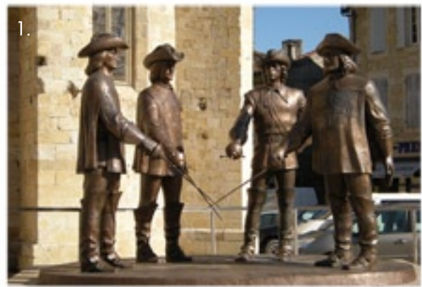
1. Condom, sur la vallée de la Baïse

Soutenu par l'AF3V, la FFCT et Cyclo-Camping International.