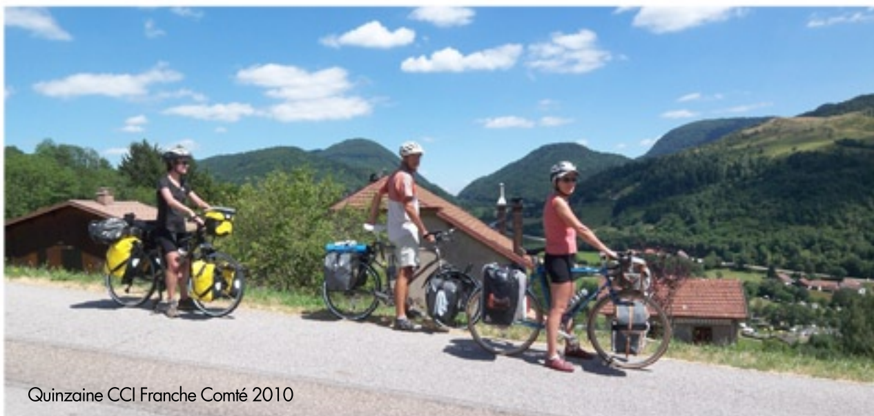
Quinzaine CCI Franche Comté 2010