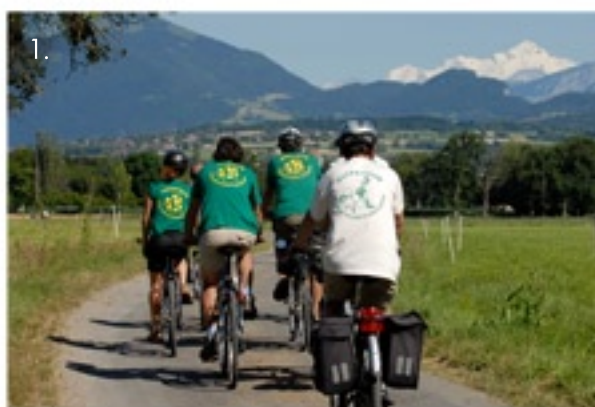
1. et 2. Alter Tour 2011, en Haute-Savoie

Nous devons "Vivre simplement pour que d'autres puissent simplement vivre" (Gandhi).