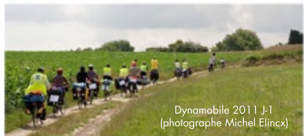
Dynamobile 2011 J-1

Cette année, la rando de l'association française CyclotransEurope (CTE) ira de Cologne à Pontoise, d'où Dynamobile partira. Les Dynamobiliens qui souhaiteraient rallier Pontoise à vélo, pourraient accompagner CTE. Dynamobile et CyclotransEurope partagent les mêmes valeurs associant promotion du vélo et plaisir des vacances à vélo. Elles organisent deux randonnées en une, quand l'une finit, l'autre commence.