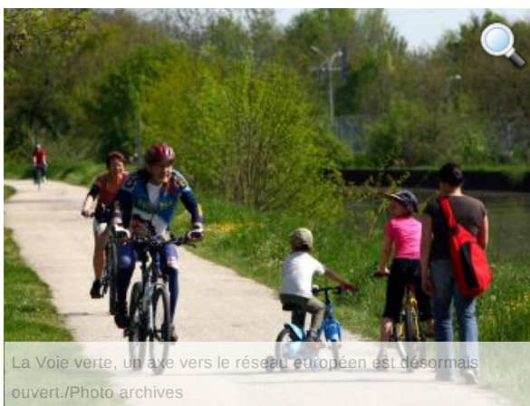
La Voie verte, un axe vers le réseau européen est désormais ouvert.

Les randonneurs cyclistes seront heureux d'apprendre que la Vélodyssée, inaugurée le week-end dernier, ouvrira de nouvelles perspectives pour notre voie verte du canal de Garonne